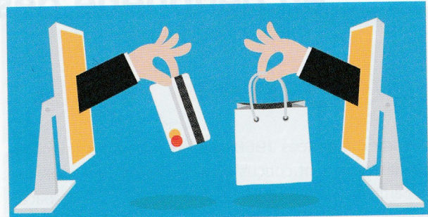
3 Le e-commerce

Le secteur de l'économie numérique est en pleine croissance et emploie de plus en plus de personnes à mesure que les nouvelles technologies de l'information et de la communication progressent. En 2014, en France, 700 000 personnes travaillaient dans ce secteur, comme vendeurs et réparateurs de matériel, informaticiens, programmeurs, développeurs de sites Internet, vendeurs de téléphonie mobile... D'autres travaillent dans la vente de biens sur Internet qu'on appelle e-commerce.