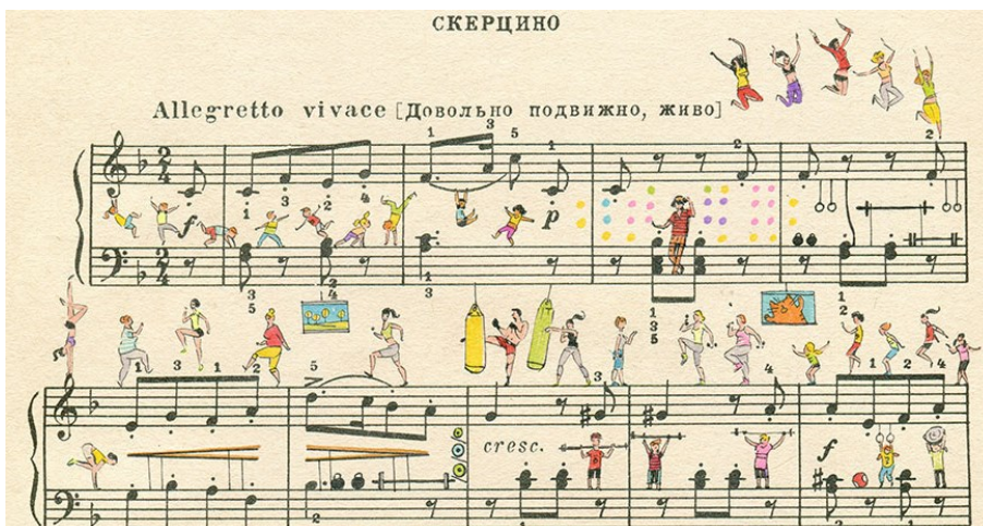
Partitions détournées par deux dessinateurs russes