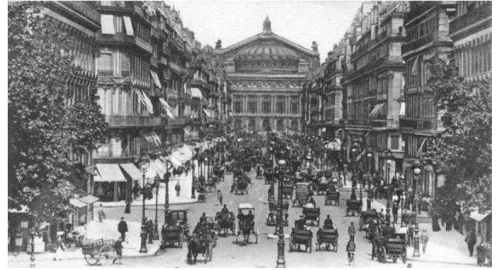
L'avenue de l'Opéra avant et après les travaux entrepris par le baron Haussmann

Qui fait effectuer de grands travaux à Paris au XIX ème siècle ? C'est l'empereur Napoléon III.