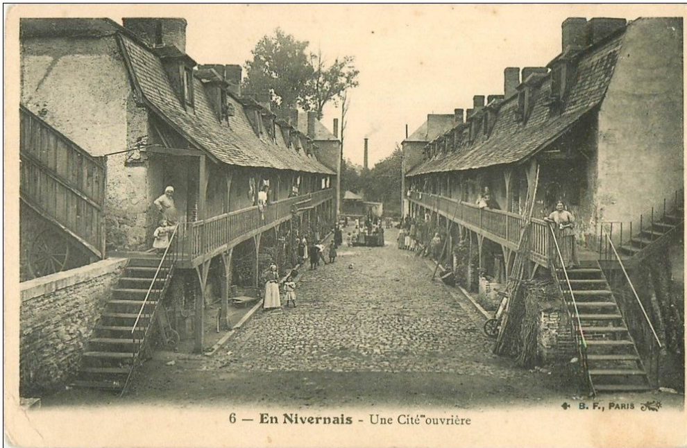
Doc 3 – Une Cité ouvrière en Nivernais

Grâce à la Révolution industrielle , de nouveaux matériaux vont entrer dans la construction des bâtiments (l'acier, le ciment...). Les grands patrons d'usine construisent rapidement des cités ouvrières où tous les logements sont identiques et sans confort. Les familles ouvrières vivent dans de petits espaces. Les femmes, les hommes et les enfants travaillent.