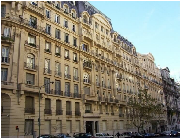
Doc 1- Un immeuble haussmannien construit au XIX e siècle à Paris.

À Paris ou Marseille, on doit ces changements au baron Haussmann , préfet de Paris.