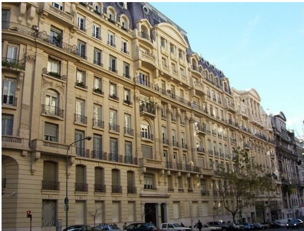
Doc 1 - Un immeuble haussmannien construit au XIX e siècle à Paris.

À Paris ou Marseille, on doit ces changements au baron Haussmann , préfet de Paris.