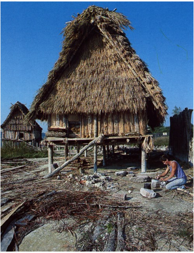
Reconstitution d'une maison du Néolithique à Chalain dans le Jura