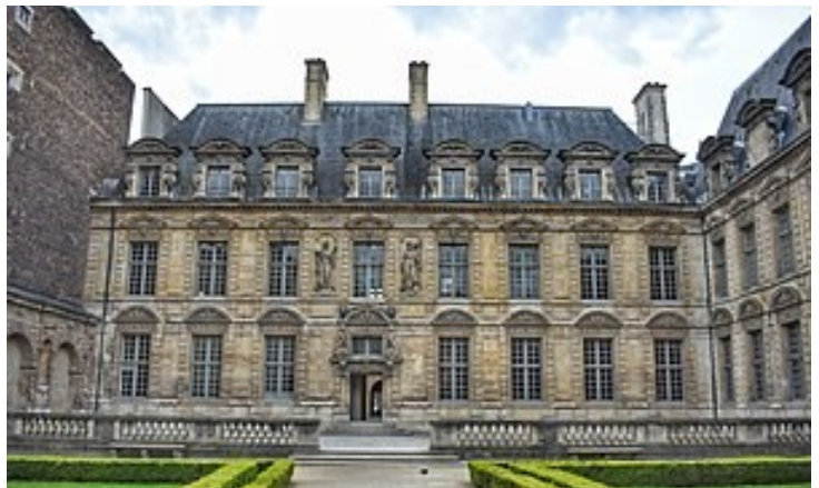
Cour d'honneur de l'Hôtel particulier de Sully

Les nobles et grands bourgeois s'inspirent de l'architecture Renaissance et veulent montrer leur richesse. Leurs grandes maisons font penser aux constructions antiques (colonne, symétrie...), et disposent de larges fenêtres. À l'intérieur, le mobilier est plus diversifié, mais il n'y a pas encore vraiment de confort.