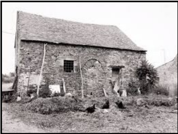
Villepôt (Loire-Atlantique), le Bas-Plessis, Logis paysan, XVIIe siècle

À la campagne comme en ville, les habitations populaires sont donc plus solides, mais restent très modestes et sans confort (sans vitre, sans eau, sans cabinets de toilette...) Les fermes sont composées de corps de bâtiment espacés pour éviter que le feu ne se propage en cas d'incendie.