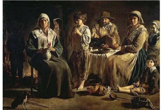
Famille de paysans dans un intérieur (1642) - Louis Le Nain

Les nobles et grands bourgeois s'inspirent de l'architecture Renaissance et veulent montrer leur richesse. Leurs grandes maisons font penser aux constructions antiques (colonne, symétrie...), et disposent de larges fenêtres. À l'intérieur, le mobilier est plus diversifié, mais il n'y a pas encore vraiment de confort.