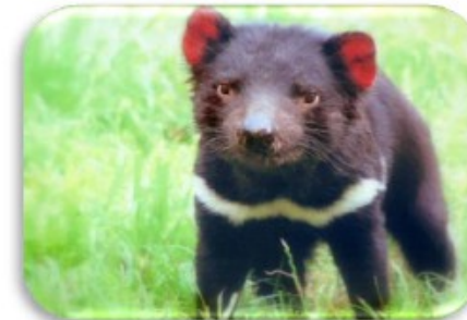
Le diable de Tasmanie